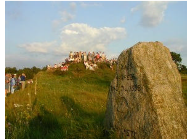
Fra Ulbjerg camping til Simested å (ca. 15 km.)

Kør mod syd ad Løgstør landevej til man ret øst for Ulbjerg by kommer til vejkrydset, hvor Tingvej passerer. Denne følges nu mod øst – mod Møldrup. Alene navnet Tingvej lader ane, at vi er på sporet af et eller andet. Herom senere. Ca. 3 km. inde i Flensborgs plantage møder vi på venstre hånd den anelige Støvhøj, hvis kote på 42 m. over havet er et af områdets højeste steder. Desværre er der – grundet plantagen – ikke meget udsyn fra toppen. Snart åbner landskabet sig dog dramatisk på anden vis, nemlig når vi dukker ud af plantagen på vej ned mod den imponerende Simested ådal. Til højre breder heden sig som et minde om, hvorledes store dele af denne egn så ud for mindre end 100 år siden.